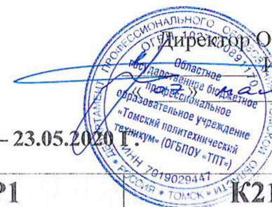
ГРАФИК ЭКЗАМЕНАЦИОННОЙ СЕССИИ НА ПЕРИОД С 18.05.2020 – 23.05.2020 г.