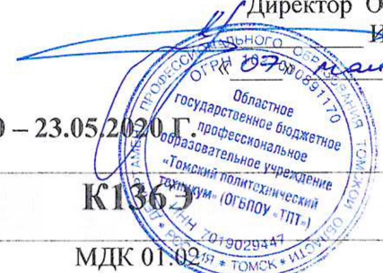
ГРАФИК ЭКЗАМЕНАЦИОННОЙ СЕССИИ НА ПЕРИОД С 18.05.2020 – 23.05.2020 Г.