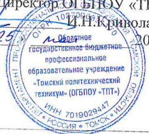
ГРАФИК ЭКЗАМЕНАЦИОННОЙ СЕССИИ НА ПЕРИОД С 01.06.2020 – 03.06.2020 Г.